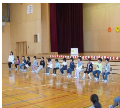
【座る姿勢が素晴らしい】