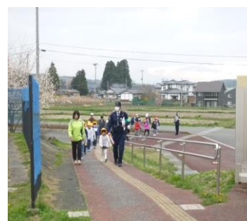
【左右確認を確実に】